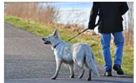
Hunde sind an der Leine zu führen.

Hunde müssen im Bereich des Geh- und Radweges (Naturerlebnis Schottergrube) an der Leine oder mit Maulkorb geführt werden. Da es immer wieder zu Problemen mit Hundebesitzern kommt, können auf Grund dieser Verordnung Verstöße gegen diese Anordnungen mit Geldstrafen bis zu 7.000 Euro geahndet werden (gemäß Öö. Hundehaltengesetz 2002).