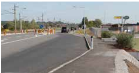
Abbiegespur und Bushaltestelle B1

Auch der Löschwasserbehälter für den gesamten Gewerbepark Mitte sowie die Abbiegespur auf der B1/Gewerbepark Ost wurden fertiggestellt.