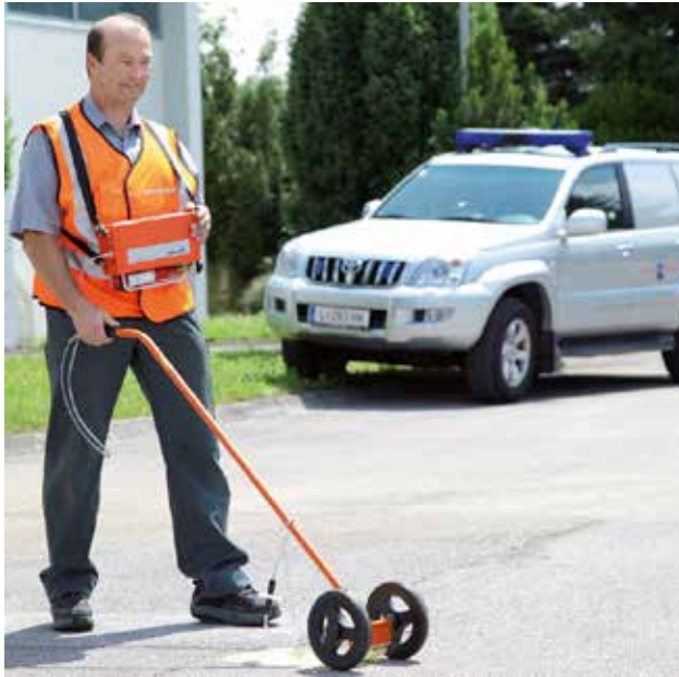
Erdgasleitungen werden in den nächsten Wochen überprüft

Im Zuge der Überprüfung der Gebäudezuleitungen ist es eventuell auch notwendig, Privatgrundstücke zu begehen. Die damit beauftragten Spezialisten der Netz OÖ weisen sich auf Verlangen selbstverständlich aus.