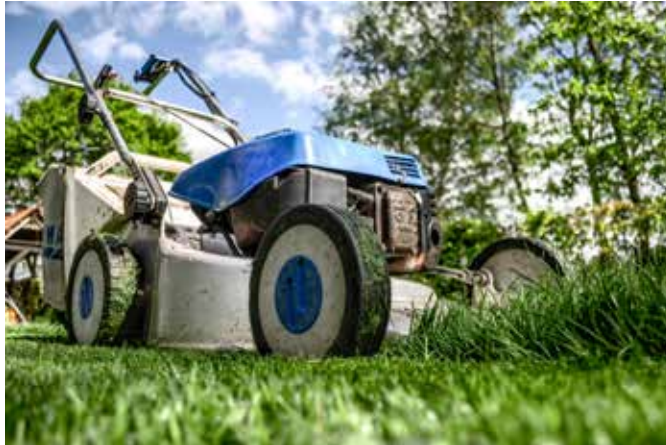
Rasenmähen zu den Ruhezeiten oder an Sonntagen führt immer wieder zu Auseinandersetzungen

Wenn das Verhalten im Freien von gegenseitiger Rücksichtnahme auf Nachbarn bzw. Anrainer geprägt ist, beugt dies nicht nur Auseinandersetzungen vor, sondern trägt dazu bei, dass es für alle Gemeindebürger ein schöner, erholsamer Sommer wird.