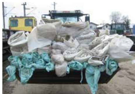
Agrarfolien werden wieder gesammelt

Abwasserverband Ager-West, Kläranlage, Ahamer Str. 63, Attnang-P.