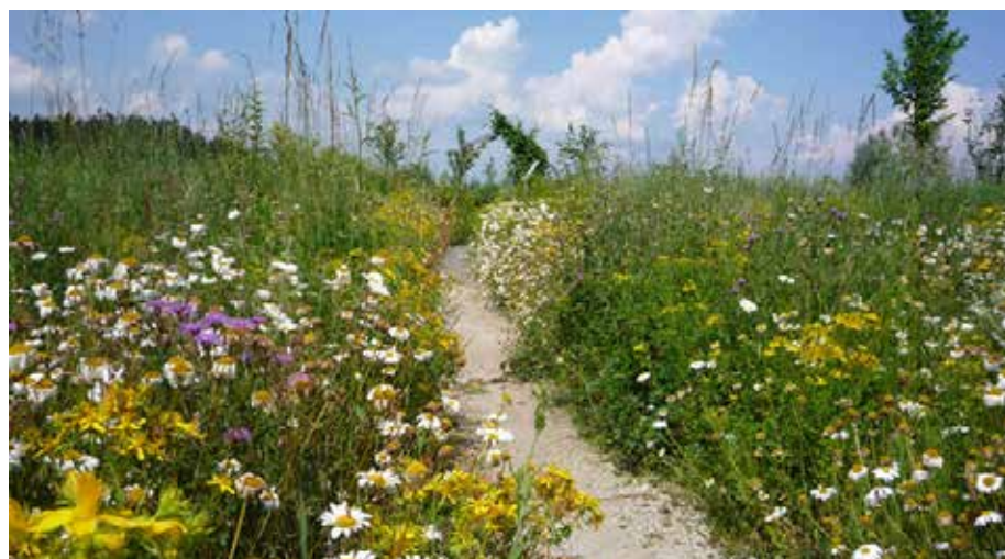
Wer eine Blumenwiese anlegt, leistet einen wertvollen Beitrag zum Schutz von Bienen und Insekten

Wichtig: Das Saatgut kann nur auf einem umgegrabenen Boden aufgebracht werden.