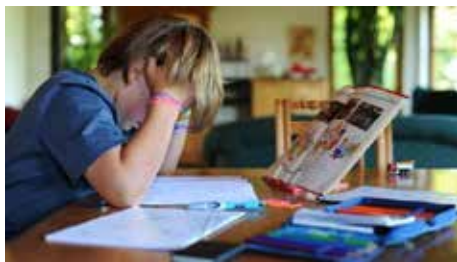
Für viele Kinder ist Homeschooling eine Belastung

› Für Kinder und Jugendliche sind stabile Beziehungen zu den Eltern und Freundinnen und Freunden sowie gute Bewältigungsstrategien von besonderer Bedeutung. Sie benötigen Zuversicht, soziale Bindungen und positive Erlebnisse. Planen Sie gemeinsame Familienzeiten mit viel Abwechslung und Bewegung ein. Versuchen Sie dabei allen Bedürfnissen gerecht zu werden und Ihre Kinder in die Ideenfindung einzubinden.