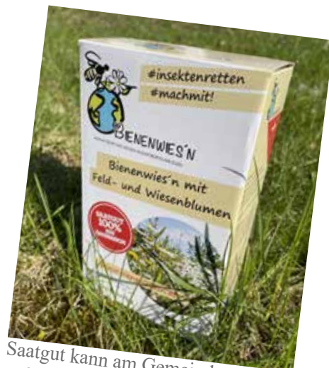
Saatgut kann am Gemeindeamt zum geförderten Preis gekauft werden

Es handelt sich um mehrjähriges 100% regional zertifiziertes Saatgut. Ein Infoblatt für die richtige Anlage und Pflege liegt jeder Packung bei.