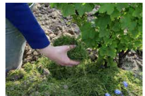
Rasenschnitt kann als Dünger oder Mulchmaterial eingesetzt werden

Tipp: Sie können den Rasenschnitt zum Mulchen bzw. zugleich Düngen im Garten einsetzen. Die mit Mulchmaterial zugedeckte Erde muss nicht mehr ständig gejätet und gegossen werden.