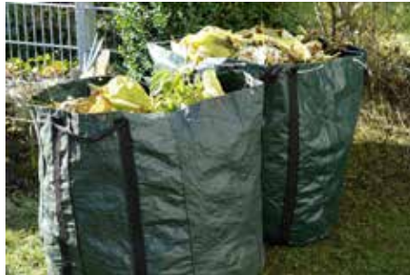
Änderungen bei der Entsorgung von Grünschnitt für Erlau und Hainprechting.

Sollten Sie dazu eine (neue) Berechtigungskarte benötigen, erhalten Sie diese am Gemeindeamt.