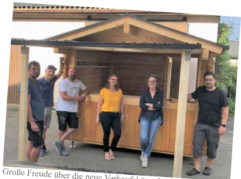
Große Freude über die neue Verkaufshütte für den Adventmarkt.