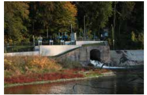
Ökostrom aus dem Wasserkraftwerk Au/Redlham.

Der von der Gemeinde überschüssig erzeugte und nicht verwertbare Strom wird in das regionale Stromnetz eingespeist; umgekehrt wird im Bedarfsfall zukünftig Strom nur noch von regionalen Ökostromanbietern bezogen werden.