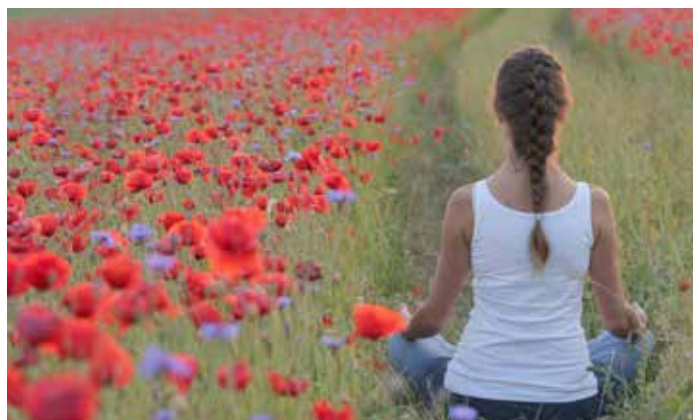
Tief durchatmen! Mit Atemübungen kann man das Wohlbefinden und die Gesundheit steigern.

Achtsamkeit ist eine innere Haltung, bei der man die Aufmerksamkeit bewusst auf das „Hier und Jetzt“ lenkt. Man wendet sich den eigenen Erfahrungen, Gefühlen und Gedanken ohne Bewertung zu und lernt, diese zu akzeptieren. Man kann Achtsamkeit in Kursen trainieren aber auch mit regelmäßigen Übungen im Alltag verankern. Solche Übungen zeigen bereits relativ schnell positive Effekte: man wird aufmerksamer, lernt mit Stress besser umzugehen, stärkt das Immunsystem und wird wohlwollender – sich und anderen gegenüber. Zusätzlich spürt man eigene Bedürfnisse mehr und steigert die innere Ausgeglichenheit.