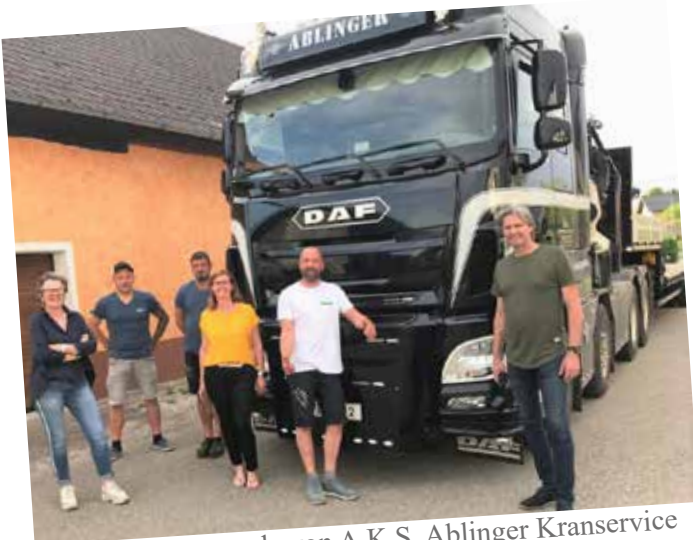
Der Transport wurde von A.K.S. Ablinger Kranservice durchgeführt.

Im Namen des gesamten Adventmarktkomitees bedanken wir uns recht herzlich für das tolle Holzhäuschen und freuen uns schon darauf, es beim nächsten Redlhamer Adventmarkt präsentieren zu dürfen.“