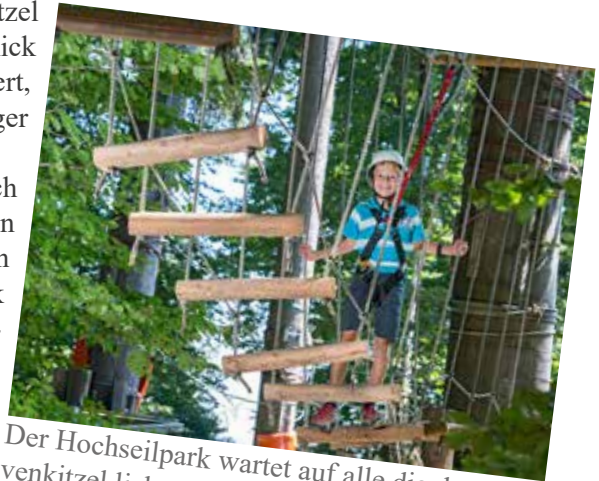
Der Hochseilpark wartet auf alle die den Nervenkitzel lieben.

Der Kostenbeitrag von 15 Euro pro Person ist bei der Anmeldung am Gemeindeamt zu bezahlen. Weiters muss von einem Elternteil eine Zustimmungserklärung unterzeichnet werden.