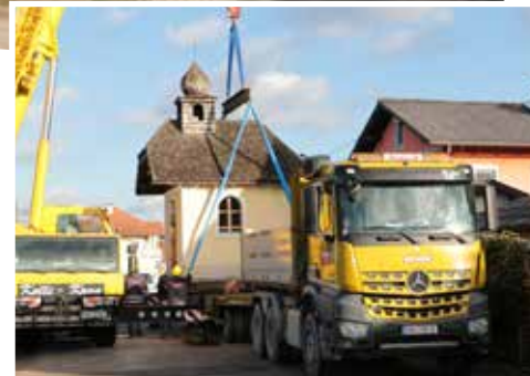
Alle Fotos der Versetzarbeiten gibts auf www.redlham.at