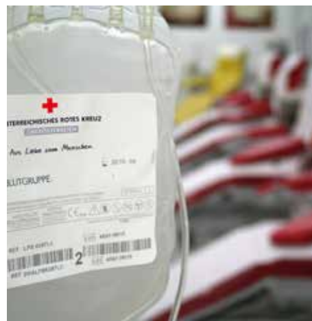
Jede einzelne Blutkonserve hilft!

Sie sollten in den letzten 3-4 Stunden vor der Blutspende zumindest eine kleine Mahlzeit und ausreichend Flüssigkeit zu sich nehmen und nach der Blutspende körperliche Anstrengungen vermeiden.