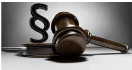
Kostenlose Rechtsberatung am Gemeindeamt

Das Rechtsanwaltsbüro Landl + Edelmann bietet dieses Service allen Redlhamer Gemeindegürgern jeden zweiten Dienstag in den geraden Kalendermonaten an.