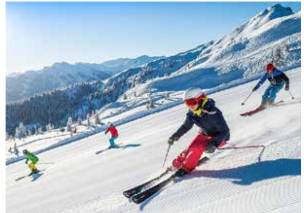
Skitag für die ganze Familie am 28. Jänner!

Für Kinder aus anderen Gemeinden kostet die Liftkarte 25,- Euro.