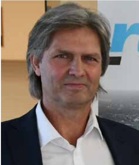
Bürgermeister Kaiß berichtet zum Jahreswechsel.